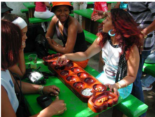
La Betania jugant amb l'Andrea, a qui algú està distraient mentre mou.