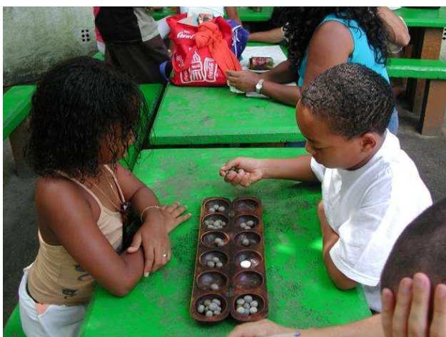
El joc encara és viu. Aquests dos infants dominicans l'han après a Villa Jaragua i el continuen jugant a Catalunya.