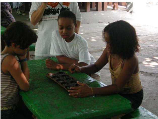
Dos infants dominicans ensenyant a jugar a una nena catalana.